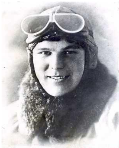
Серов Анатолий Константинович (1910-1939 гг.)

Толя выпросил у матери несколько полос старой ткани, толстую иглу, крепких ниток, приготовил клей, принес из сарая молоток. Разрезал полотно на равные части, сшил их, выстрогал гибкие длинные палки, сшитые полосы прибил к рамам. Получились широкие белые крылья. К рамам Толя приделал скобы, чтобы держаться. На ветру полотнище натягивалось и тащило вперед, точно парус. Забрался на крышу бани, которая чуть возвышалась над огородными грядками. Толя развернул крылья за своей спиной во всю ширину. Крылья тянули и рвали вперед, он чувствовал, что сейчас поплывет по воздуху, как по синему морю. Сердце замерло, он взмахнул