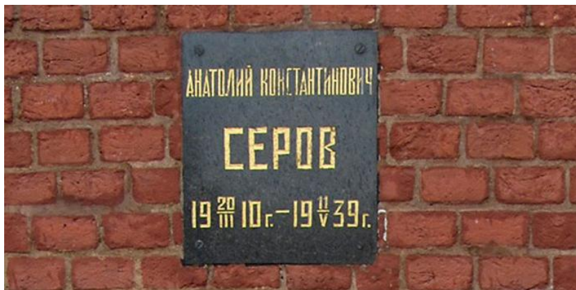
Мемориальная доска в Кремлёвской стене

В конце 1930 годов Лубянский проезд в Москве переименовали в проезд имени Серова, а в Кремлёвскую стену была замурована урна с прахом и установлена на стене мемориальная доска с надписью: «Анатолий Константинович Серов».