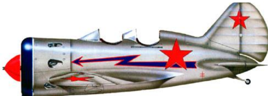
Самолёт УТИ-4 на котором погиб А.К. Серов