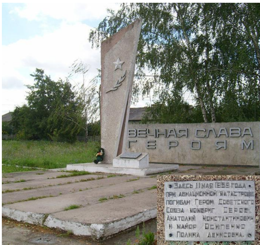
Памятник в деревне Высокое на месте гибели А.К. Серова

На месте гибели в деревне Высокое Рязанской области был установлен памятник.