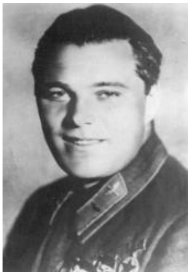
Серов Анатолий Константинович (1910-1939 гг.) Звание присвоено в 1979 г.